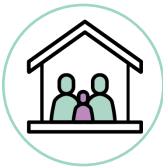
Les individus et les familles

Documenter, suivre et analyser les impacts psychosociaux et les stratégies d'adaptation en fonction de l'évolution de la pandémie sur :