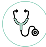
Les acteurs du réseau de la santé et serv. sociaux