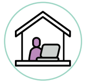
L'organisation sociale et professionnelle