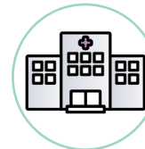
Les structures de services